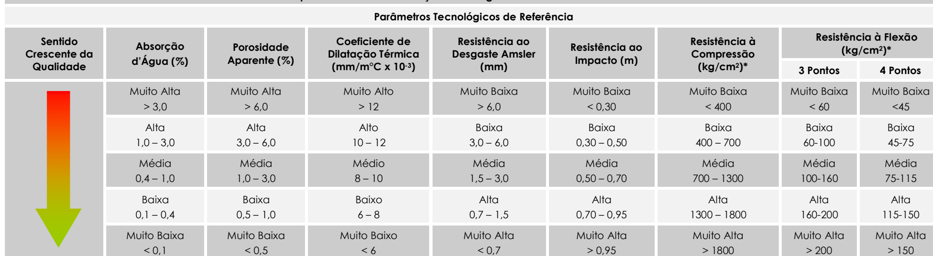
Tabela 3.8.4 – Proposta Geral de Qualificação Tecnológica das Rochas Ornamentais e de Revestimento

(*) 10 kg/cm 2 ≅ 1 MPa. Fonte: adaptado e modificado do Manual da Pedra Natural para Arquitetura (HENRIQUES & TELLO, coord., 2006)